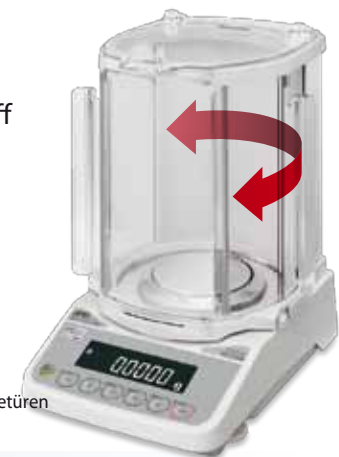
Dreh - Schiebetüren

Das einzigartig Clip-System der HR-AZ/HR-A Serie erlaubt dem Benutzer, den Windschutz mit wenigen Handgriffen abzunehmen. Dies erleichtert die Reinigung und bei optimalen Umgebungsbedingungen ermöglicht es den Einsatz ganz ohne Windschutz.